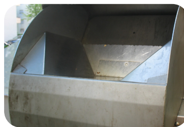
3. Danach kann die Klappe geöffnet werden