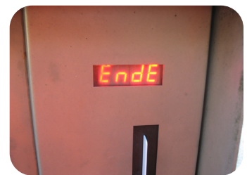
4. Nach Einwurf Klappe schließen.

Jedem Haushalt wird eine Mindesteinwurfzahl pro Jahr entsprechend der Haushaltsgröße mit dem Gebührenbescheid berechnet. Diese Gebühr setzt sich zusammen aus: