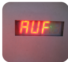
2. Display leuchtet.